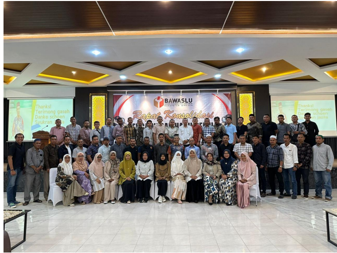
Sesi foto bersama setelah kegiatan selesai.