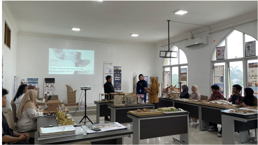
Mahasiswa Internasional dari Belanda Mengikuti Perkuliahan di Prodi Arsitektur Unimal