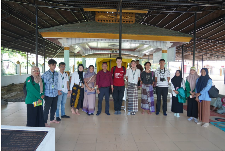
Mahasiswa Internasional Unimal Kunjungi Situs Samudra Pasai.