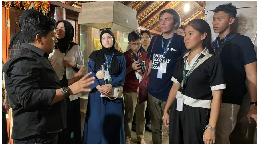
Dosen Prodi Arsitektur Mendampingi Mahasiswa Internasional Belajar Arsitektur Tradisional Rumoh Aceh di Museum Kota Lhokseumawe. Foto: B