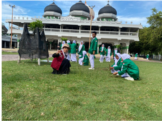
Peringati Hari Perawat Internasional, Prodi Keperawatan Unimal Adakan Pengabdian di Masjid