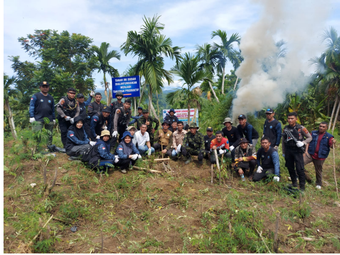
Badan Narkotika Nasional (BNN) Kota Lhokseumawe berhasil memusnahkan ladang ganja seluas tiga hektar di Dusun Cot Rawatu, Desa Jurong, Kecamatan S Utara.