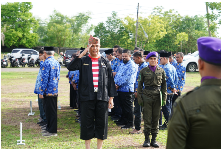
Gelar Upacara Kebangkitan Nasional , Rektor Unimal Kenakan Pakaian Adat Madura.