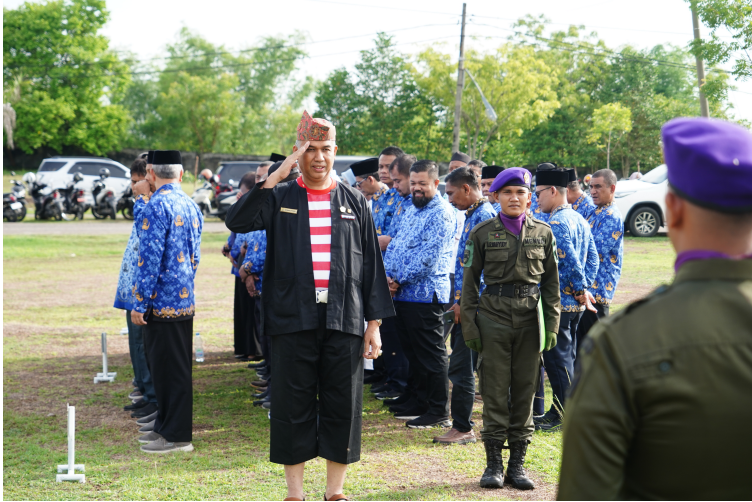
Gelar Upacara Kebangkitan Nasional , Rektor Unimal Kenakan Pakaian Adat Madura.