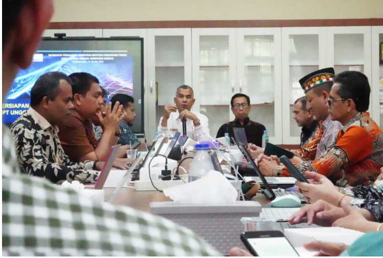
Unimal Laksanakan Workshop Penguatan Akreditasi Institusi Perguruan Tinggi.