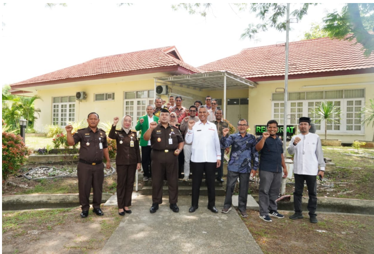
Kejaksaan Negeri Aceh Utara Tandatangani Nota Kerja Sama dengan Unimal