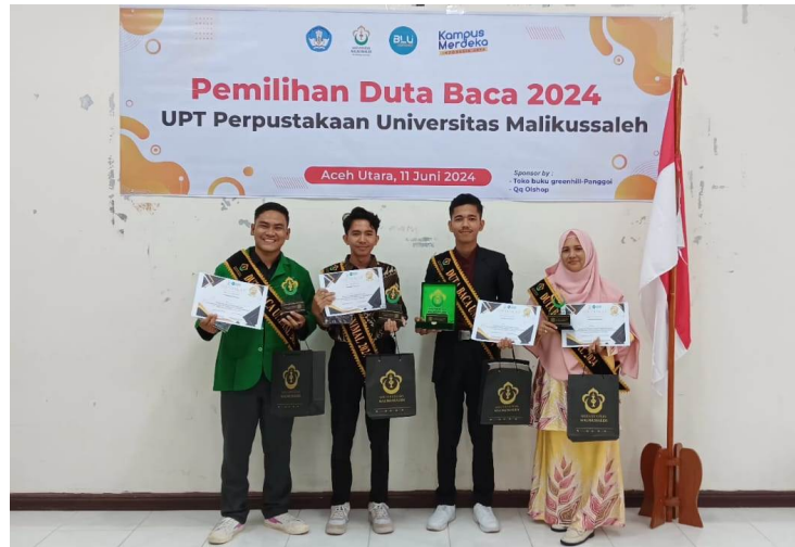
Tiga Mahasiswa dan Satu Tendik Terpilih Jadi Duta Baca 2024 UPT Perpustakaan Unimal