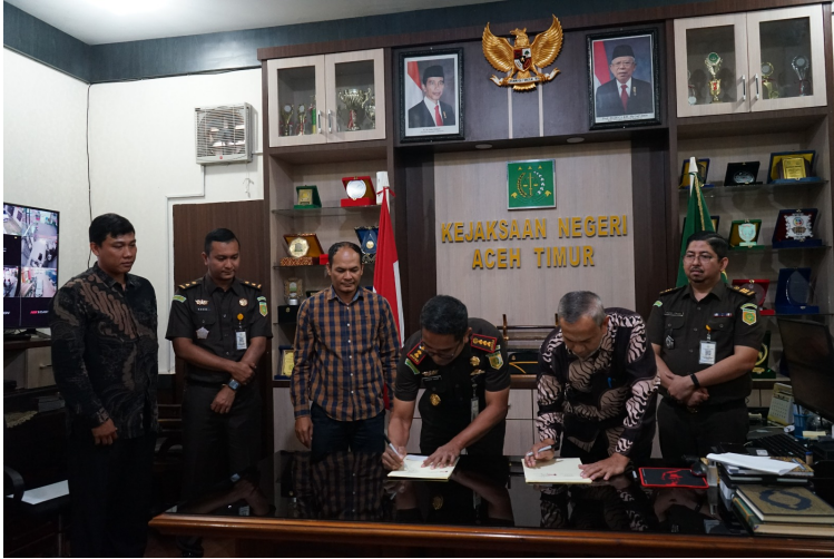
Fakultas Hukum Unimal Jalin Kerja Sama dengan Kejari Aceh Timur