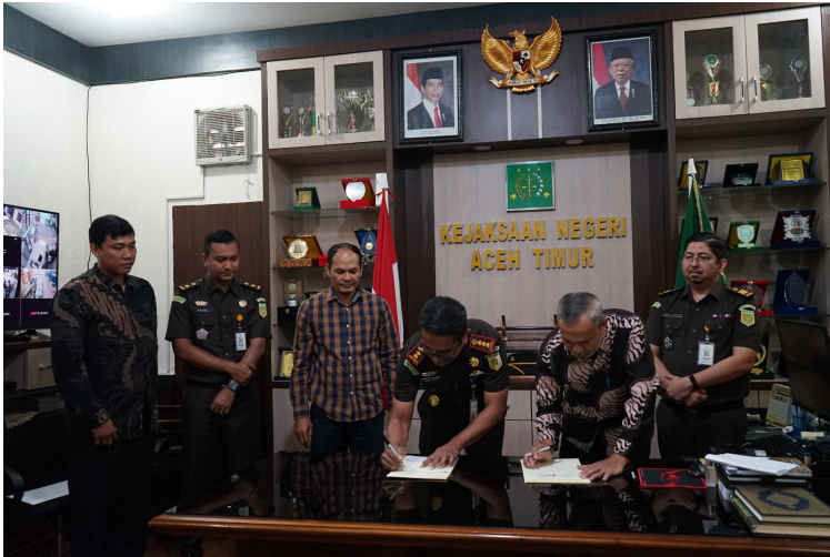
Fakultas Hukum Unimal Jalin Kerja Sama dengan Kejari Aceh Timur