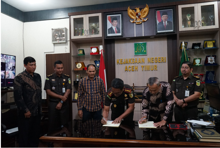
Fakultas Hukum Unimal Jalin Kerja Sama dengan Kejari Aceh Timur