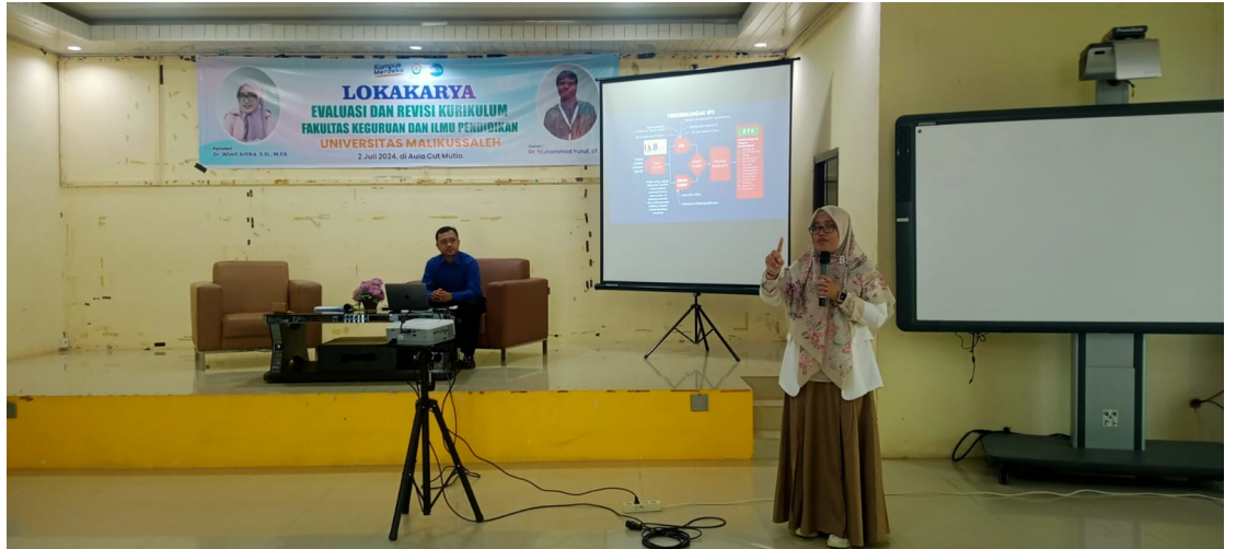
FKIP Unimal Adakan Lokakarya Evaluasi dan Revisi Kurikulum