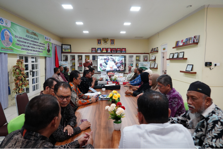
Prodi Administrasi Publik Unimal jalani Asesmen Lapangan untuk Akreditasi BAN-PT