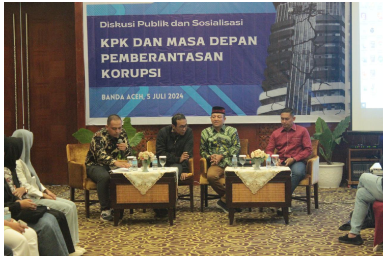
Diskusi Publik dan Sosialisasi "KPK dan Masa Depan Pemberantasan Korupsi", di Banda Aceh, Jumat, 5 Juli 2024.