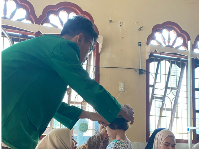
Mahasiswa KKNT Unimal dengan Puskesmas Gelar Posyandu dan Posbindu di Ceubrek.