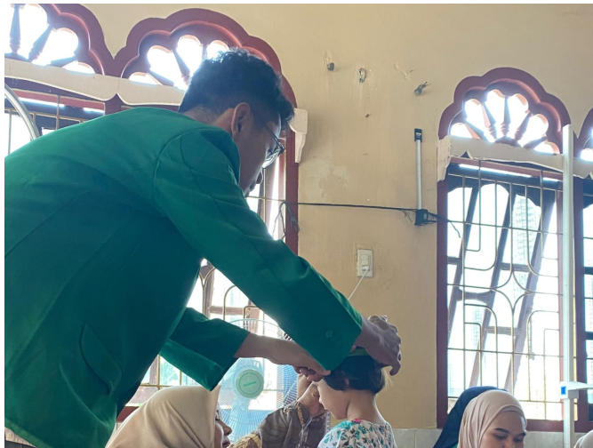
Mahasiswa KKNT Unimal dengan Puskesmas Gelar Posyandu dan Posbindu di Ceubrek.