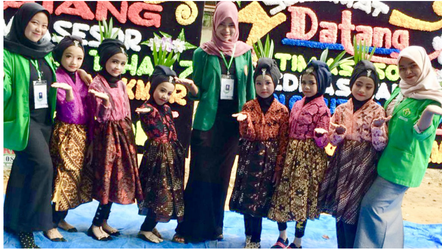
Mahasiswa KKN Kelompok 67 di Gampong Bayu Kecamatan Kuta Makmur, Aceh Utara, mengajar tari murid SD Negeri 6 setempat.