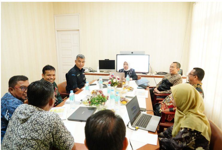
Magister Sosiologi Unimal Jalani Asesmen Lapangan untuk Akreditasi.