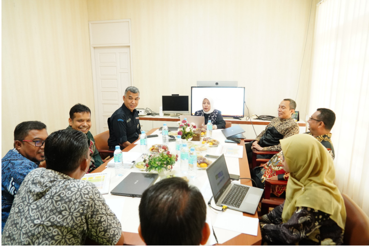
Magister Sosiologi Unimal Jalani Asesmen Lapangan untuk Akreditasi.