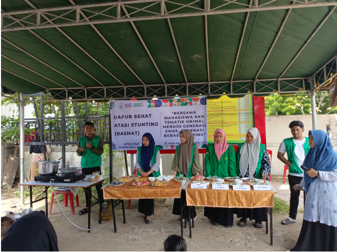
Cegah Stunting, Mahasiswa KKN-T 3 Unimal Gelar Demo Masak Makanan Sehat di Mon Geudong