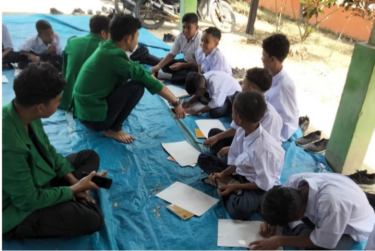
Tiga Program dalam 3 Hari, Ini yang Dilakukan Mahasiswa KKN-PPM 23 pada Siswa SMP.