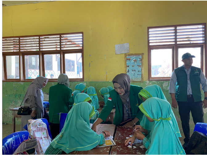
Mahasiswa KKN-PPM 25 Edukasi Pemilahan Sampah di MIN 28 Aceh Utara.