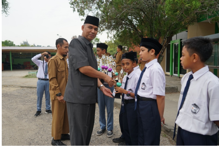
Rektor Unimal Dr Herman Fithra menyerahkan Piala kepada siswa yang memenangkan lomba.