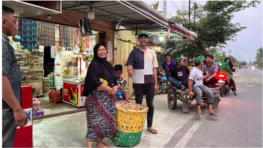
Mahasiswa KKN-PPM 24 Informasikan Pengurangan Buang Sampah Sembarangan.