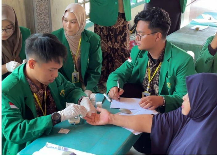
Mahasiswa KKNT 08 Gelar Pemeriksaan Kesehatan dan Sosialisasi Tanaman Herbal.