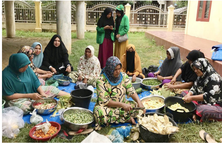
Mahasiswa KKN Kelompok 60 Universitas Malikussaleh di Desa Ubit Paya Itek Kecamatan Meurah Mulia, Aceh Utara, memasak kuah pliet bersama warga menjelang berakhirnya masa KKN, Minggu (22/9/2019).