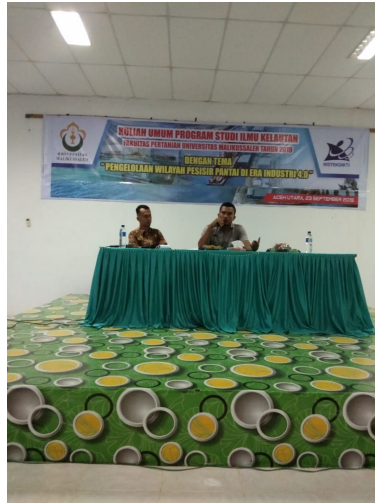
Narasumber sedang menyampaikan materi dalam kegiatan Kuliah Umum Ilmu Kelautan Fakultas Pertanian Universitas Malikussaleh, Senin (23/9).