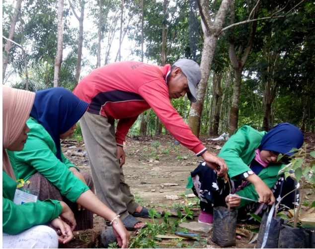
Mahasiswa KKN Universitas Malikussaleh kelompok 65 sedang melakukan penyambungan bibit durian di gampong Alue Rambe Kecamatan Kuta Makmur, S (21/9/2019).