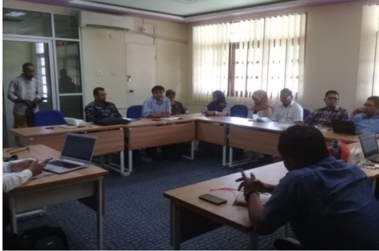
SUPERVISI - Supervisi Borang Prodi di lingkungan FKIP Unimal, Kampus Bukit Indah, Lhokseumawe.