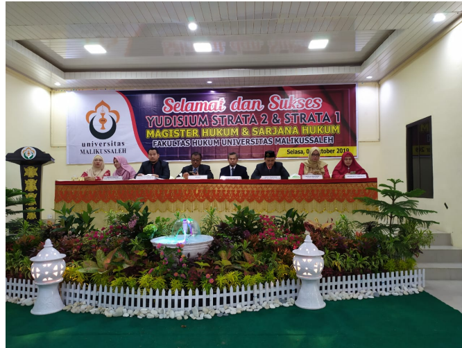
Dekan Fakultas Hukum Universitas Malikussaleh bersama para Pembantu Dekan dan Ketua Prodi dalam pelaksanaan Yudisium, Selasa (1/10/2019). FOTO :