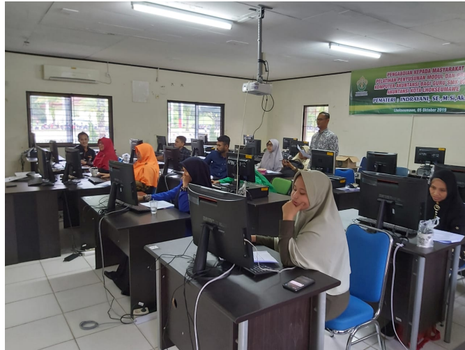
Pelaksanaan Program Pengabdian Kepada Masyarakat oleh prodi akuntansi Universitas Malikussaleh, Sabtu (6/10/2019).