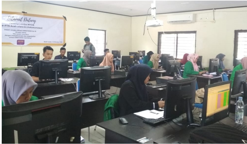
Peserta Lomba Komputer penggunaan aplikasi akuntansi MYOB 24 sedang mengerjakan soal dalam Lomba yang digelar oleh Himatansi Universitas Malikussabtu (12/10/2019).