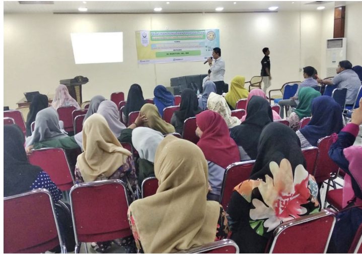
Himpunan Mahasiswa Ekonomi Pembangunan (Himep) Fakultas Ekonomi dan Bisnis Universitas Malikussaleh melaksanakan sosialisasi dan workshop Program Kreativitas Mahasiswa (PKM) 2019/2020 di Kampus Bukit Indah, Lhokseumawe, Rabu (16/9/2019).