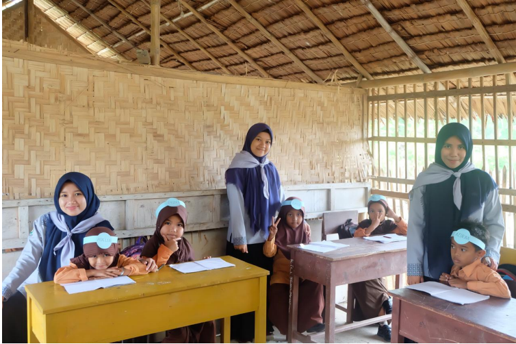
Himapka FKIP Unimal buat kegiatan Matematika Mengajar.