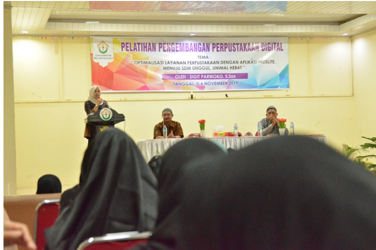
UPT Perpustakaan Universitas Malikussaleh mengadakan pelatihan pengembangan perpustakaan digital.