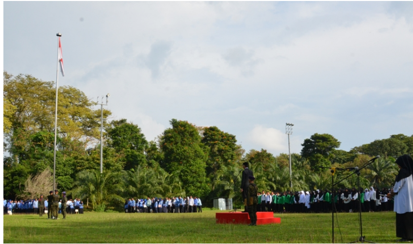
Upacara pengibaran bendera merah putih dalam rangka memperingati Hari Pahlawan tahun 2019.