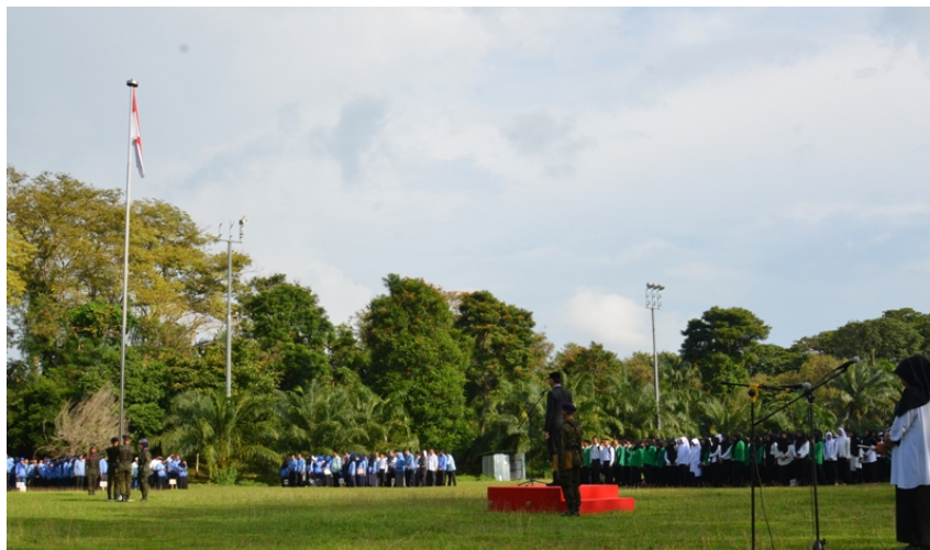
Upacara pengibaran bendera merah putih dalam rangka memperingati Hari Pahlawan tahun 2019.