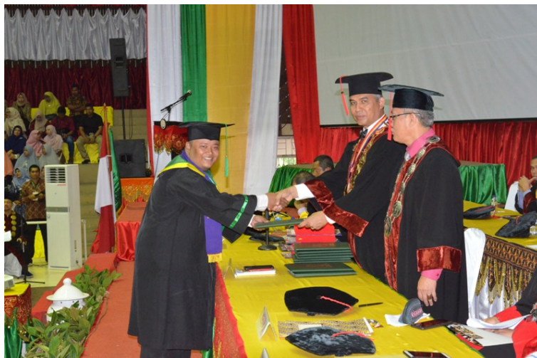
Universitas Malikussaleh mewisuda lulusan angkatan XXIII di GOR Komplek Perumahan PT Perta Arun Gas Batuphat, Lhokseumawe, Rabu (20/11).