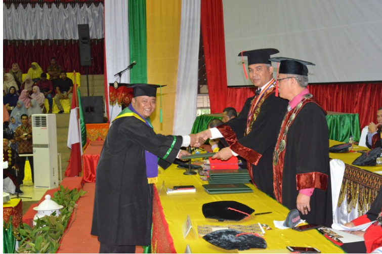
Universitas Malikussaleh mewisuda lulusan angkatan XXIII di GOR Komplek Perumahan PT Perta Arun Gas Batuphat, Lhokseumawe, Rabu (20/11).