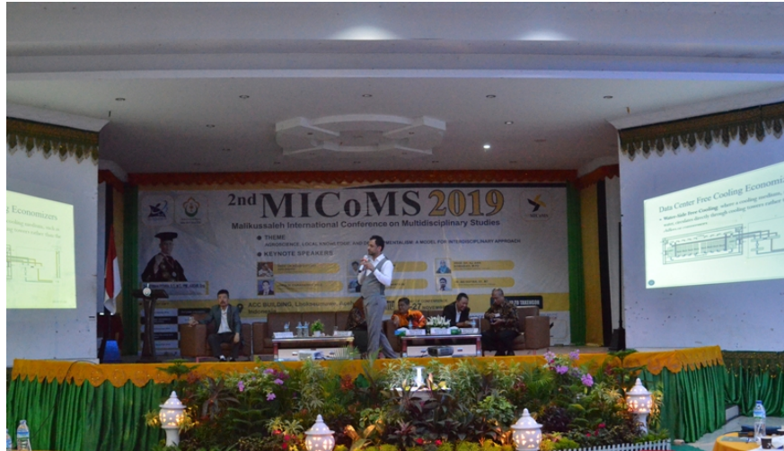
LPPM Unimal Gelar Seminar Internasional "MICoMS" Selama Dua Hari.