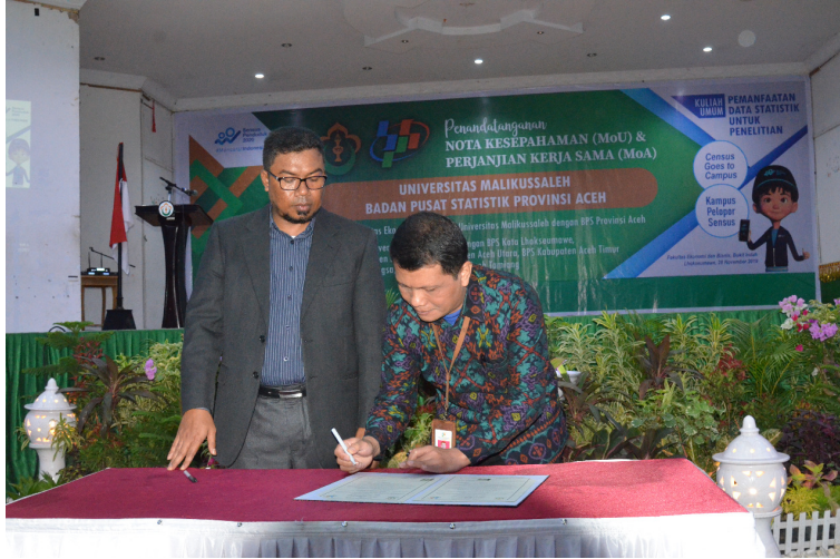
Universitas Malikussaleh menandatangani Nota Kesepahaman (MoU) dan Perjanjian kerjasama (MoA) dengan Badan Pusat Statistik Provinsi Aceh, Kamis (28/11).