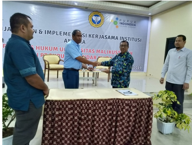
Fakultas Hukum Universitas Malikussaleh melakukan penandatanganan Perjanjian Kerjasama (MoA) dengan PT Pupuk Iskandar Muda (PIM) , di Aula Cut Meutia Kampus Bukit indah, Lhokseumawe.