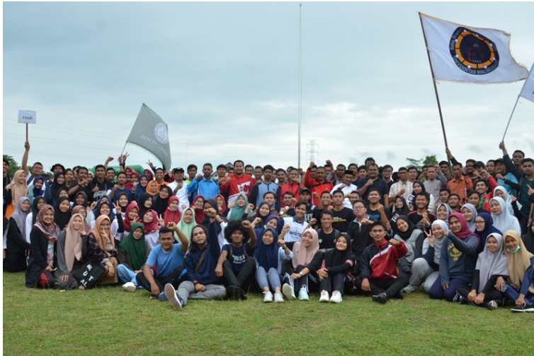
Anggota DPD RI H Sudirman, PR III Dr Baidhawi dan sejumlah dekan di Unimal foto bersama peserta Pekan Olahraga Mahasiswa.