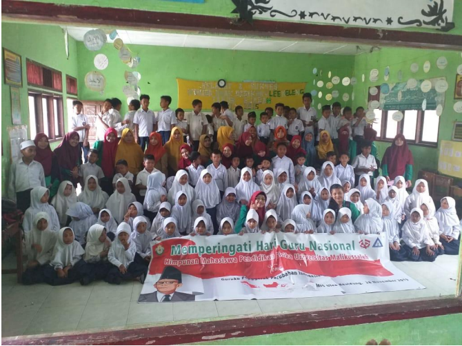
Mahasiswa Pendidikan Fisika Unimal Peringati Hari Guru di MIS Ulee Reuleung.