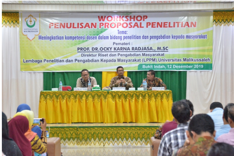
LPPM Universitas Malikussaleh gelar workshop penulisan proposal penelitian di Aula Cut Mutia Kampus Bukit indah, Lhokseumawe, Kamis (12/12).