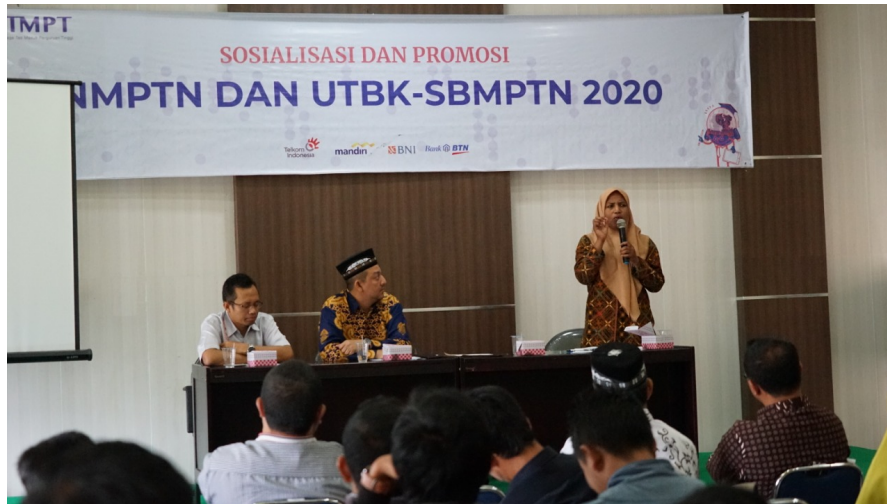
Sosialisasi SNMPTN di Gedung PPMG, di Cabang Dinas Pendidikan Aceh Tengah, Sabtu (14/12).