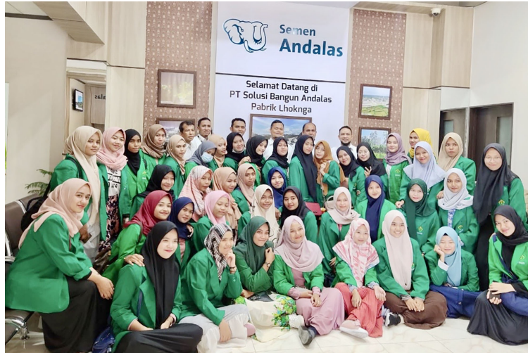
Mahasiswa Fakultas Ekonomi dan Bisnis Universitas Malikussaleh mengunjungi pabrik semen Andalas di Lhoknga, Aceh Besar, untuk mendalami tentang manajemen pemasaran dan analisis rantai nilai, Jumat (13/12/2019).