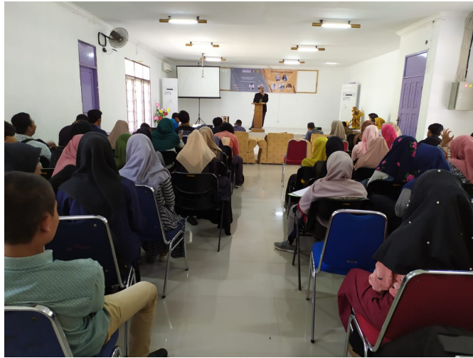
HIMAKO Fakultas Ilmu Sosial dan Ilmu Politik Universitas Malikussaleh mengadakan diskusi publik peran milenial dalam politik Indonesia di Kampus Bukit Indah, Lhokseumawe, Kamis (19/12).