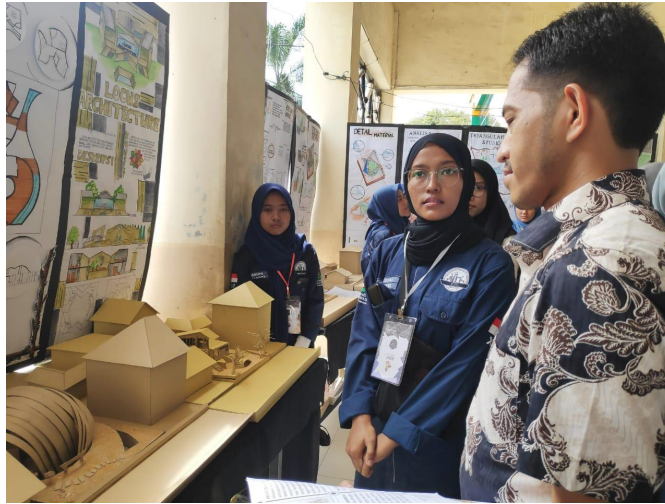
Program Studi Arsitektur Universitas Malikussaleh menggelar kegiatan Exhibition Architecture Design Studio ke-2 di Prodi Arsitektur Unimal di Lancang Garam, Lhokseumawe, Senin (23/12)