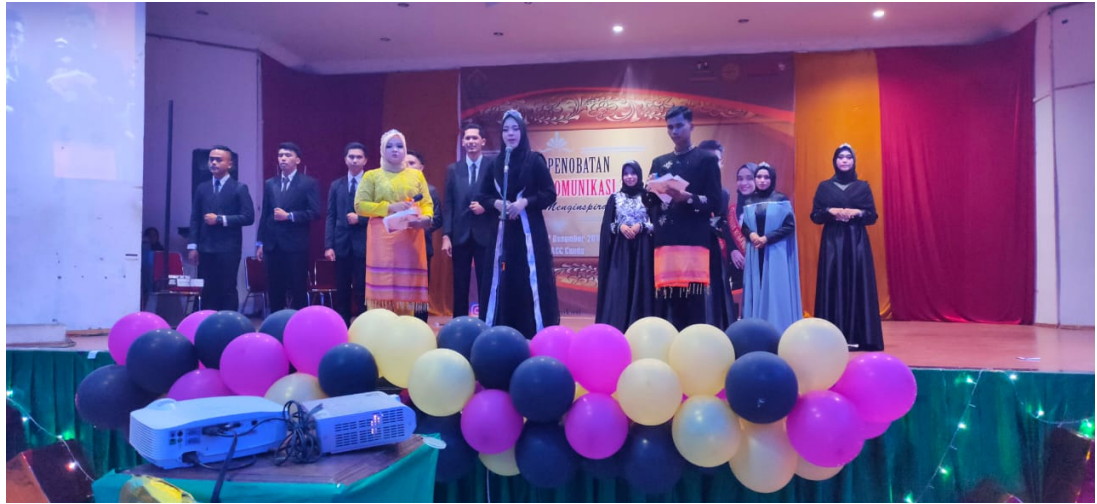
Suasana Pemilihan Putra Putri Komunikasi Universitas Malikussaleh 2019, Lhokseumawe (27/12/2019).