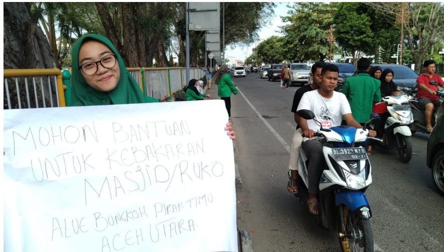
Aksi Solidaritas Himasos Unimal Untuk Korban Kebakaran di Pirak Timu.