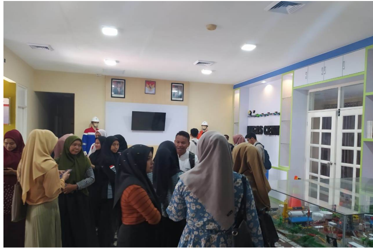
Sejumlah Mahasiswa mengunjungi Migas Center Unimal.