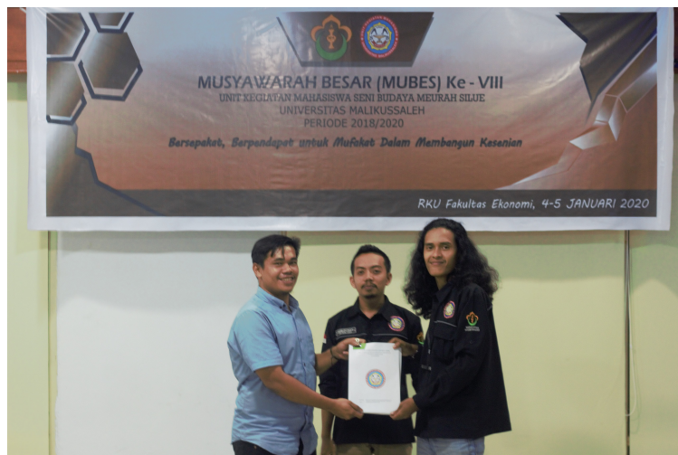
Unit Kegiatan Mahasiswa (UKM) Seni dan Budaya Meurah Silue Universitas Malikussaleh.