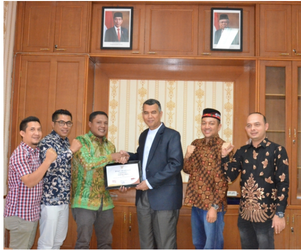
KIP Aceh Utara memberikan Sertifikat Piagam Penghargaan dari KPU RI kepada Unimal.