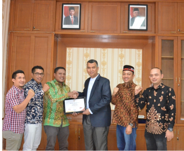
KIP Aceh Utara memberikan Sertifikat Piagam Penghargaan dari KPU RI kepada Unimal.